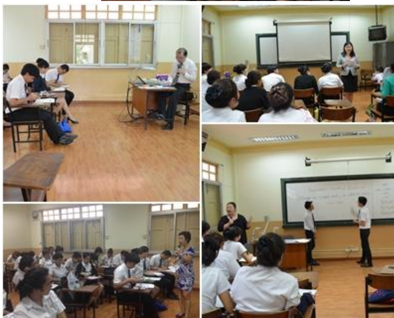
บรรยากาศการเรียนการสอน (Teaching & Learning Atmosphere)